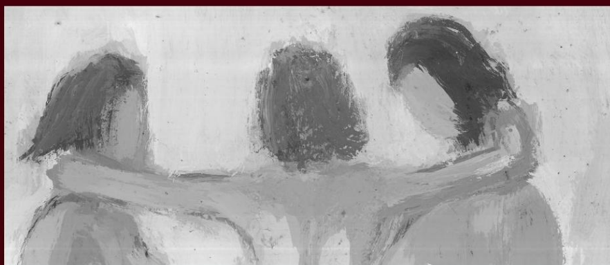
Λεπτομέρεια σε ασπρόμαυρο, από έργο του Γιώργη Παυλόπουλου. Πλαστικό σε χαρτί, 50 x 35 εκ., 1983